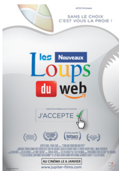
Les Nouveaux Loups du Web

Nous vous proposons de venir découvrir ce film en avant première, ainsi qu'a participer au débat qui suivra, animé par des représentants de La Quadrature du Net et de Framasoft.