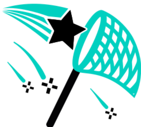
Logo de l'extension par Elisa de Guerra-Castro

Aujourd'hui, l'outil est là, revenez les amis, nous pouvons désormais tous nous partager Meta-Press.es !