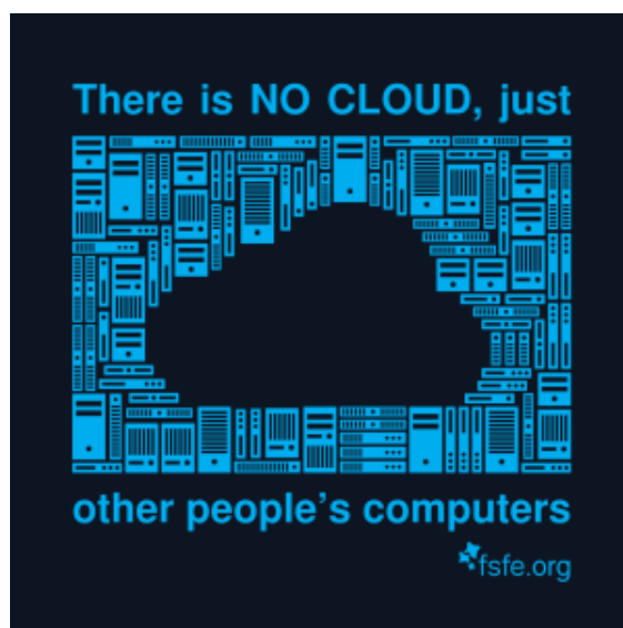
Image de nos ami-e-s de la FSFe

Comme Google Drive, Icloud et Microsoft OneDrive, tout le principe de Dropbox repose sur le degré de confiance qu'on peut accorder à une société (ici DropBox.Inc) dont les clauses d'utilisation peuvent être changées jusqu'à s'autoriser le scannage et l'usage des fichiers que vous leur confiez. Bien évidemment, personne (à part ces GAFAM) ne connaît le code des logiciels qu'ils utilisent, et donc personne d'autre qu'eux ne peut en vérifier les failles de sécurité (ou les portes dérobées). Enfin, les relations douteuses que peuvent entretenir de tels hébergeurs avec les autorités limitent grandement les droits universels à la vie privée et à la liberté d'expression, en particulier lorsque nos données sont hébergés aux USA, sous l'autorité étasunienne.