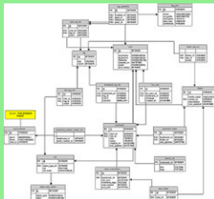
Database par gnizr (CC BY 2.0)

de se souvenir d'une information qui vous concerne, l'application la stocke dans la base de données. Parmi les systèmes de gestion de bases de données (SGBD) les plus populaires on trouve notamment MySQL et PostgreSQL.