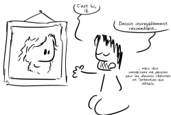
John P. Barlow

Né en 1917 dans le Wyoming, il étiquette sensiblement de son éducation mormone lorsqu'il découvre le LSD et devient parolier pour le groupe Grateful Dead.