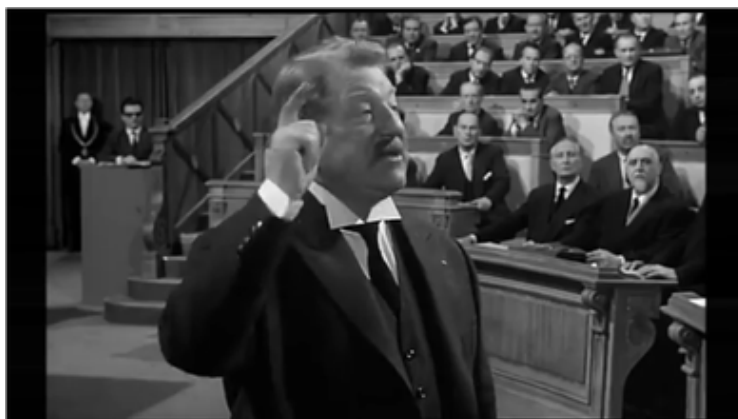
Dans le film d'Henri Verneuil le Président (1961), le vieux

Peut-être et surtout, il faut se blinder. Mon apprentissage politique, je l'ai commencé à l'Hadopi, je suis un peu tombée de mon arbre à ce moment-là et quand j'ai fait mes premiers pas à l'Assemblée Nationale, pour un UMP, on était à peine sorti de la guerre Copé-Fillon. Mine de rien, ça forge et j'avais une place d'autant plus privilégiée que je ne prenais pas les coups. Mais je voyais les autres en prendre et en donner. Alors, j'ai observé, j'ai regardé et j'ai appris.