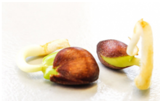
Germination de pépins de pomme

faciliter sa germination en la trempant dans du vinaigre quelques heures pour simuler une digestion animale et le laisser deux mois au frigo si l'hiver n'est pas assez froid. C'est accessible à chacun. L'idéal étant de trouver des pommes locales adaptées à notre région.