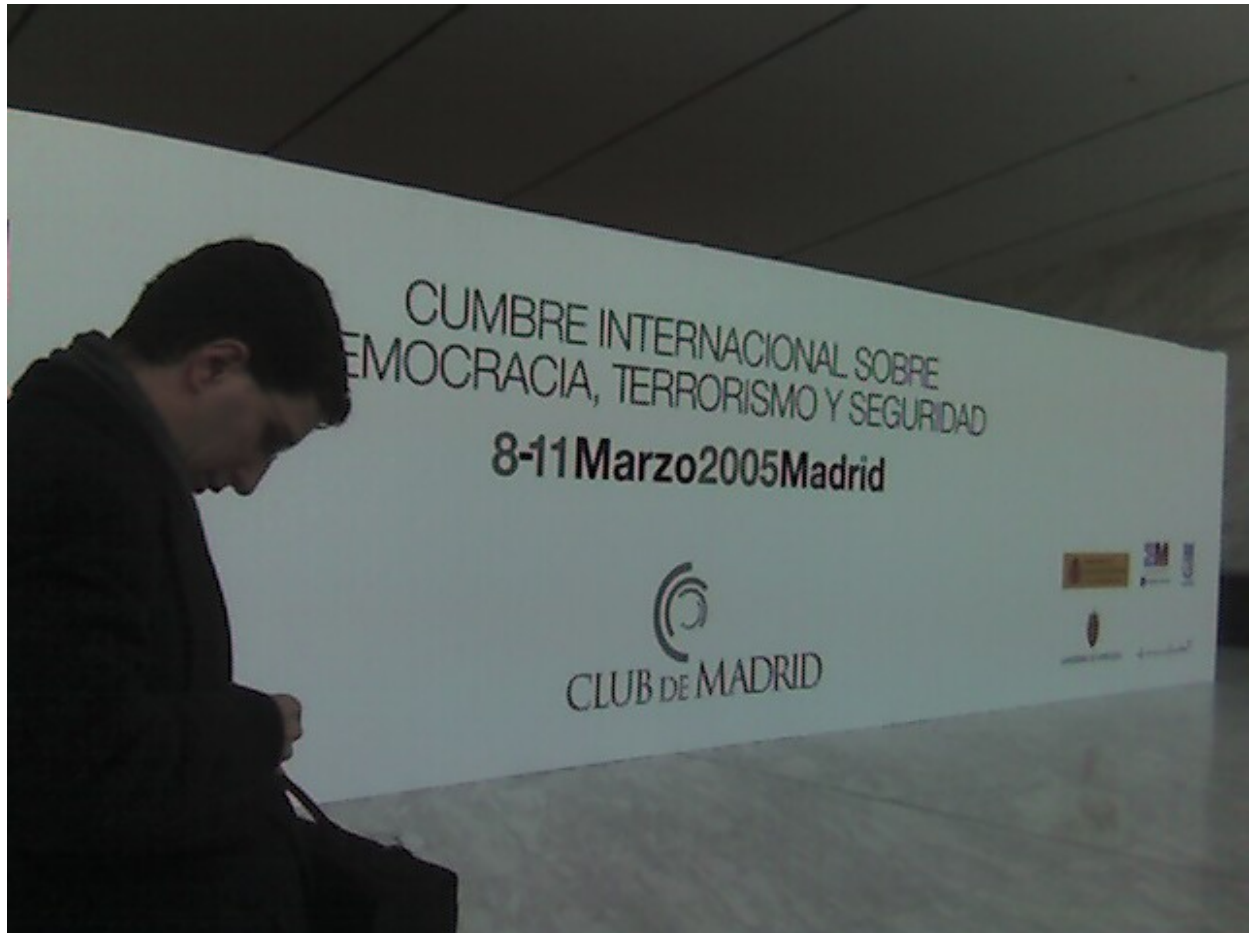
Madrid summit on democracy