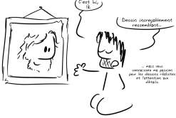
John P. Barlow

1) Né en 1917 dans le Wyoming, il étiquette sensiblement de son éducation mormone lorsqu'il découvre le LSD et devient parolier pour le groupe Grateful Dead.