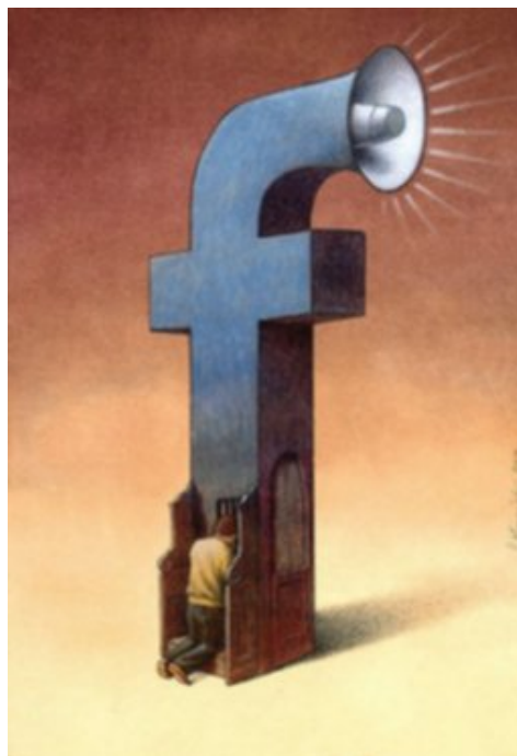
Dessin réalisé par l'artiste Pawel Kuczynski (son site Web)

En surveillant les messages, les commentaires et les interactions sur le site, Facebook peut savoir quand les personnes âgées de 14 ans se sentent « vaincues », « submergées », « stressées », « anxieuses », « nerveuses », « stupide », « idiot », « inutile » et « échec ». Ces informations recueillies au moyen d'un système sur l'analyse du sentiment pourraient être utilisées par les annonceurs pour cibler les jeunes utilisateurs de Facebook lorsqu'ils sont potentiellement plus vulnérables.