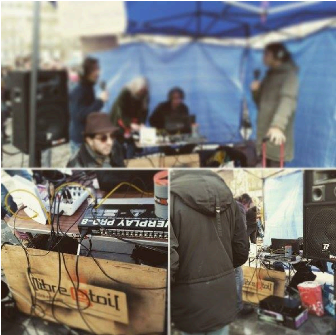
Stand de Libre@Toi*

Salut OliCat, même si à Framasoft on connaît bien Libre@Toi*, rappelle nous un peu qui tu es et ce que tu fais.