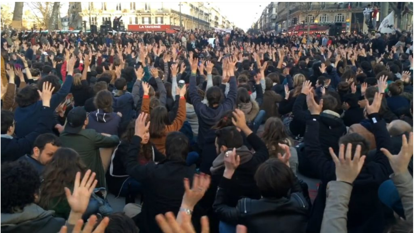
Séance de vote à Nuit Debout

Chez Framasoft on aime bien quand les gens utilisent nos services « Dégooglisons ». C'est pour ça que quand on a vu que le mouvement Nuit Debout utilise l'outil Framacarte et l'intégrer sur son site officiel notre première réaction ça a été : « Chouette ! ». Notre deuxième ça a été : « Et si on interviewait ce joyeux geek qui a repris la Framacarte pour lui demander ce qu'il en pense ? ».