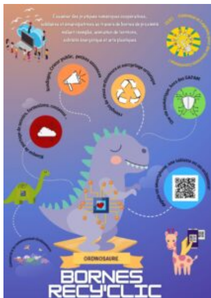
Une affiche de présentation des bornes Recy'cl'ic par Uto de R(d)évolution