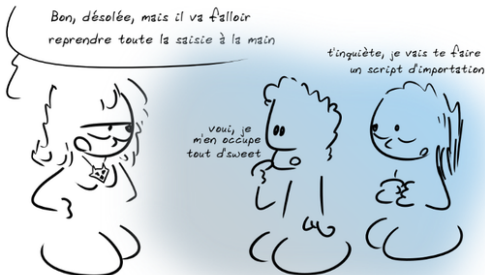
fig.1 Travailler en équipe pour résoudre un problème. La théorie.

En formant l'une des deux bénévoles, on s'aperçoit ensemble que de nombreuses données de l'ancienne base sont erronées depuis quelques mois (suite à une maintenance de M. Calisson) et que ces erreurs ont été (évidemment) reportées sur la nouvelle base. Nous arrivons à une conclusion terrifiante : il faut repasser manuellement derrière chacune des 1275 adhésions à partir des bordereaux d'adhésion, conservés par précaution. Cette opération nous a coûté 4 à 5 heures. La bénévole a eu la gentillesse de m'apporter une pizza pour que je puisse finir mon travail d'esclave le plus vite possible sans sortir du bureau.