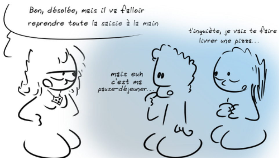
fig.2 Travailler en équipe pour résoudre un problème. La réalité.