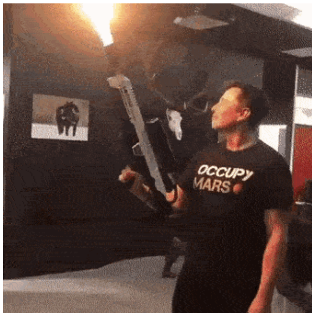
Elon Musk jouant avec nos attentions (allégorie).

Que ce rachat de Twitter par le milliardaire conservateur se finalise ou non, au final peu importe : le danger a toujours été là.