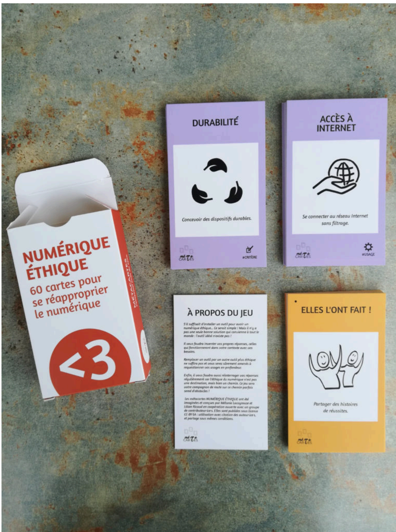
Aperçu des cartes Numérique éthique