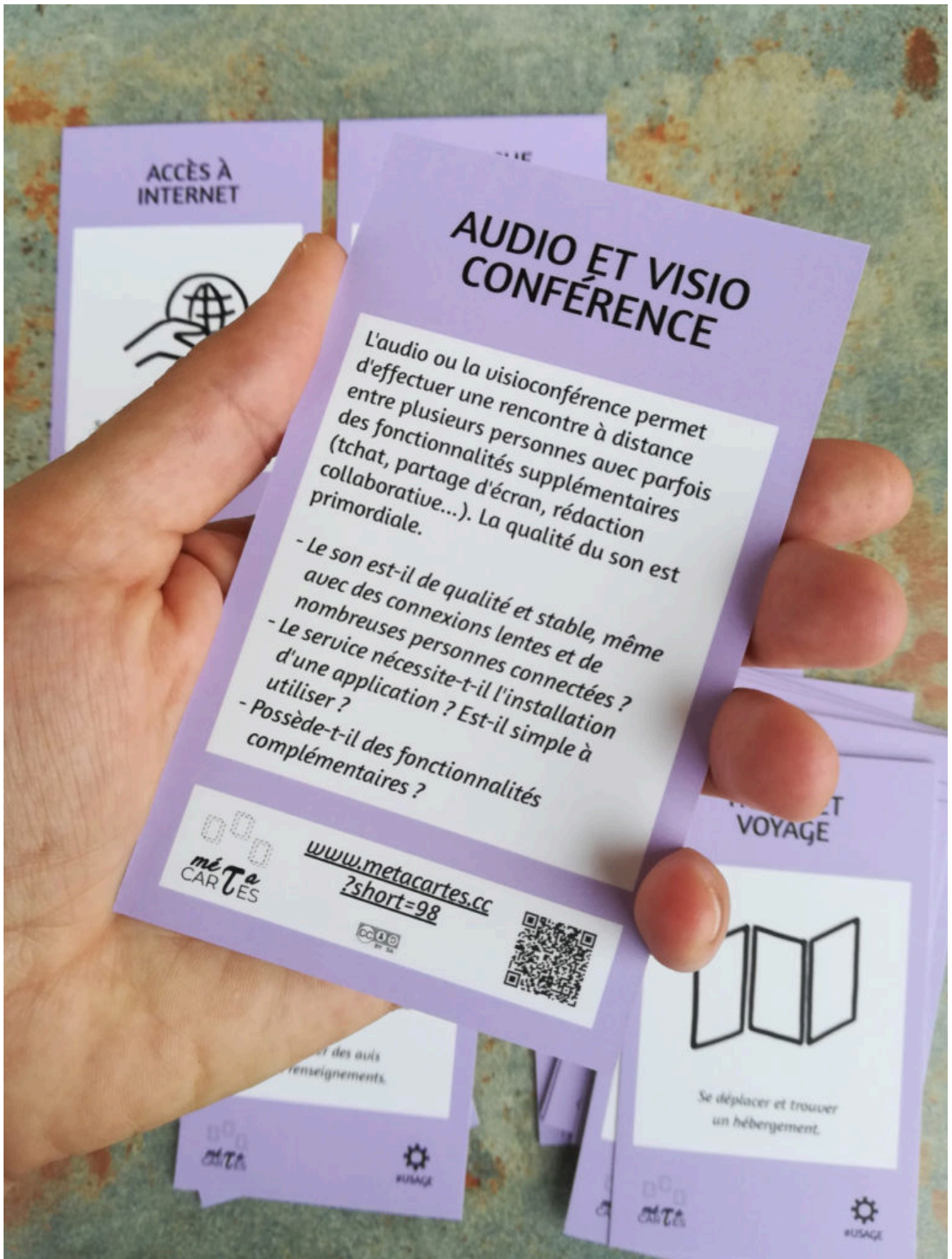
carte ingrédient usage audio et visio conference

Pour chaque usage, il y a plusieurs propositions de sous-usages plus précis et à chaque fois, un lien vers un outil ou un tutoriel.