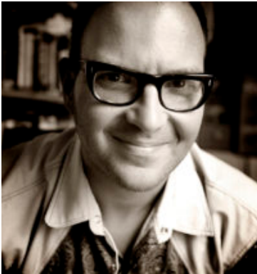
Cory Doctorow

Quand le Patriot Act a été promulgué aux USA le 26 octobre 2001, il a fait disparaître un grand nombre des contrepouvoirs vitaux qui s'interposaient entre le peuple américain et son gouvernement. Alors que les partisans de Bush applaudissaient le pouvoir sans précédent que leurs représentants à Washington détenaient désormais, les militants des libertés civiles les avertissaient : « Votre président vient de créer une arme qui sera utilisée par tous ceux qui le suivront ».