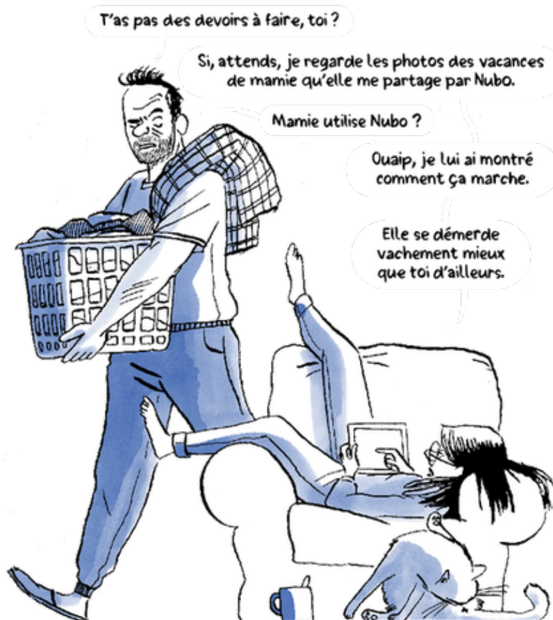
Illustration de Lucie Castel