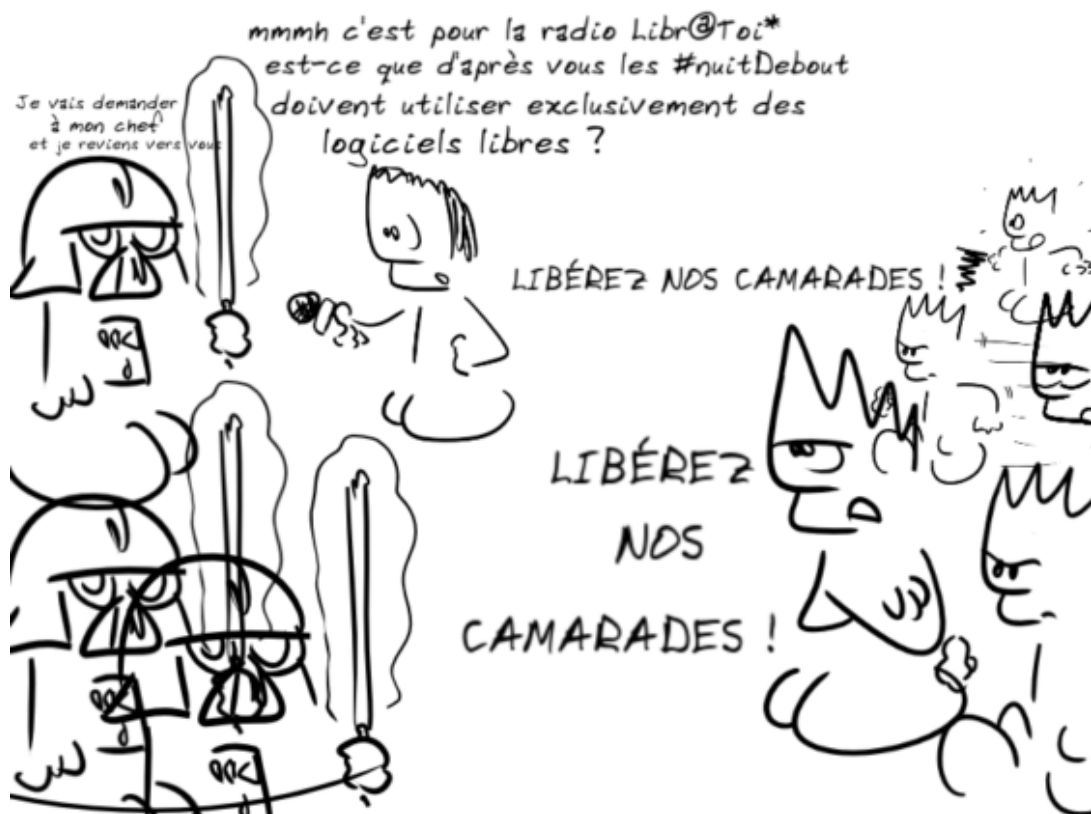
une interview sur le place de la République

Donc, pour te répondre : les Nuits Debouts sentent bien une pression au sujet du logiciel libre puisque d'autres que nous, La Quadrature par exemple, ont tenté de les y sensibiliser. Mais c'est clairement quelque chose de lointain. Un truc auquel ils n'ont pas pensé et dont la logique politique leur échappe complètement.