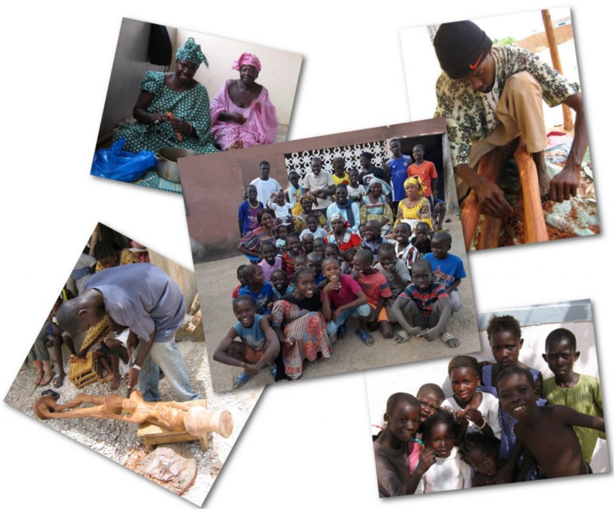
La famille de Laity

Famille sénégalaise rencontrée lors des voyages auquel ce projet vient en aide.