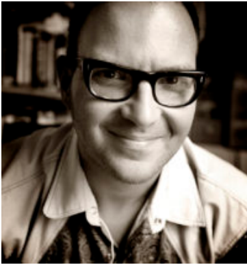
Cory Doctorow

Quand le Patriot Act a été promulgué aux USA le 26 octobre 2001, il a fait disparaître un grand nombre des contrepouvoirs vitaux qui s'interposaient entre le peuple américain et son gouvernement. Alors que les partisans de Bush applaudissaient le pouvoir sans précédent que leurs représentants à Washington détenaient désormais, les militants des libertés civiles les avertissaient : « Votre président vient de créer une arme qui sera utilisée par tous ceux qui le suivront ».