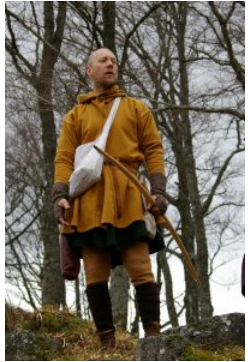
L'auteur en tenue de chasseur médiéval

L'enquête menée par Ernaut est aussi une course contre la montre (hum les montres n'existaient pas au fait, c'est une expression hein), pourquoi est-ce si urgent de trouver le coupable ?