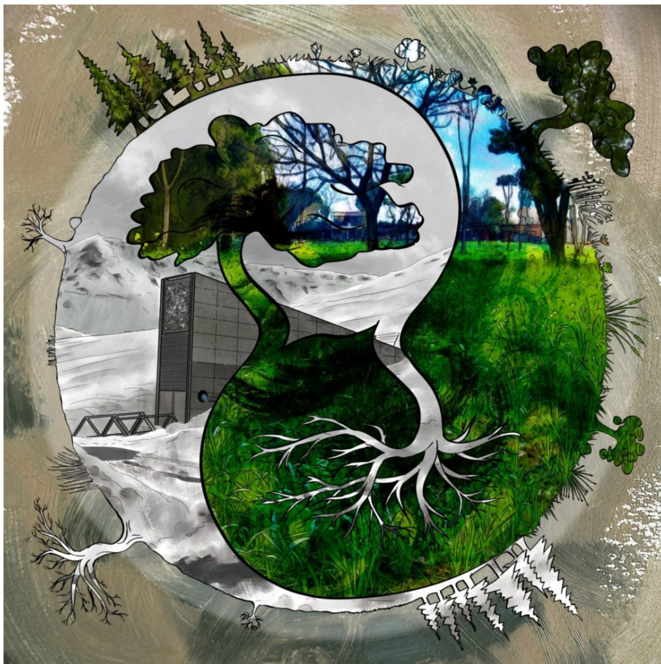
Yin-Yang seed – Œuvre de Nylnook , CC-BY-SA

Comment commencer ? En partageant du contenu libre sur le site (photos, textes, dessins), en essayant de réaliser des plants chez soi et/ou en participant à la petite communauté qui débute autour de ce site.