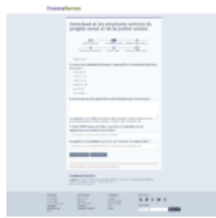
Survey Page #2