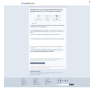
Survey Page # 3