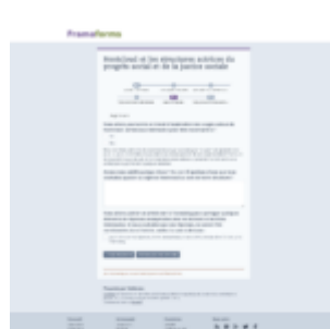
Survey Page #5

Arrêtons nous déjà sur ce travail d'enquête. Quels en ont été les résultats ?