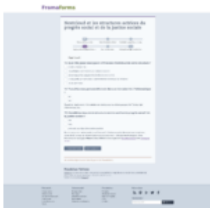
Survey Page #4