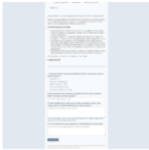
Survey Page #1