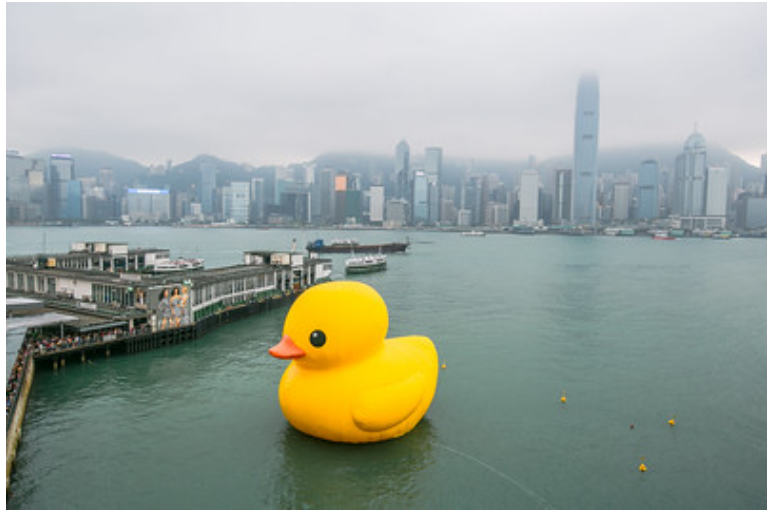
« Hong Kong Giant Rubber Duck » par IQRemix, licence CC BY-SA 2.0.

Pour ce qui est de l'équipe, il faut que je me lâche et j'accepte d'essayer ce concept du « canard en plastique », en envoyant ma partie alors qu'elle n'est pas encore dans un état où je me dis « allez c'est bon, c'est propre, je peux la faire lire ». Je n'ai jamais essayé cette méthode et c'est un peu impressionnant.