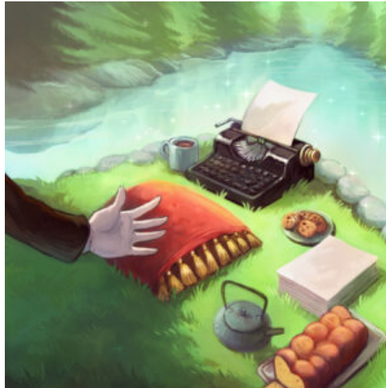
Illustration CC BY David Revoy (sources)