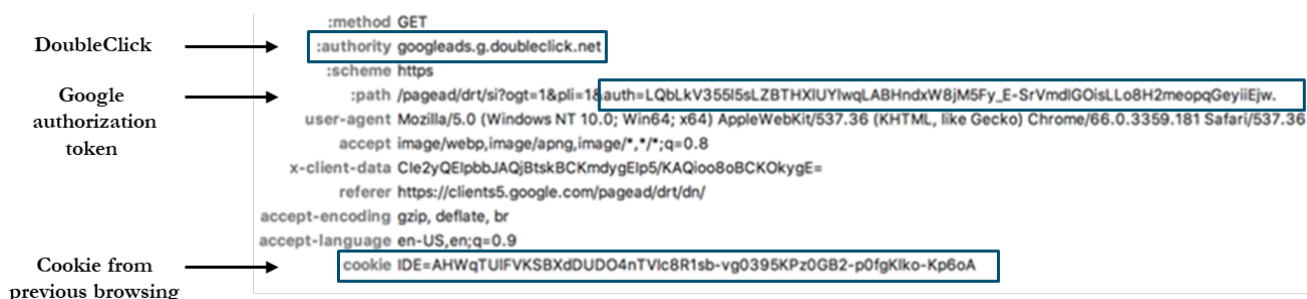
Figure 11 : La requête à DoubleClick.net inclut le jeton d'authentification Google et les cookies passés.

55. Dans la dernière étape de ce processus de connexion, une requête est envoyée au domaine DoubleClick. Cette requête contient à la fois le jeton d'authentification fourni par Google et le cookie de suivi défini lorsque l'utilisateur a visité le site web tiers à l'étape 2 (cette communication est indiquée à la figure 11). Cela permet à Google de relier les informations d'identification Google de l'utilisateur à un cookie DoubleClick. Par conséquent, si les utilisateurs n'effacent pas régulièrement les cookies de leur navigateur, leurs informations de navigation sur les pages Web de tiers qui utilisent les services DoubleClick pourraient être associées à leurs informations personnelles sur Google Account.