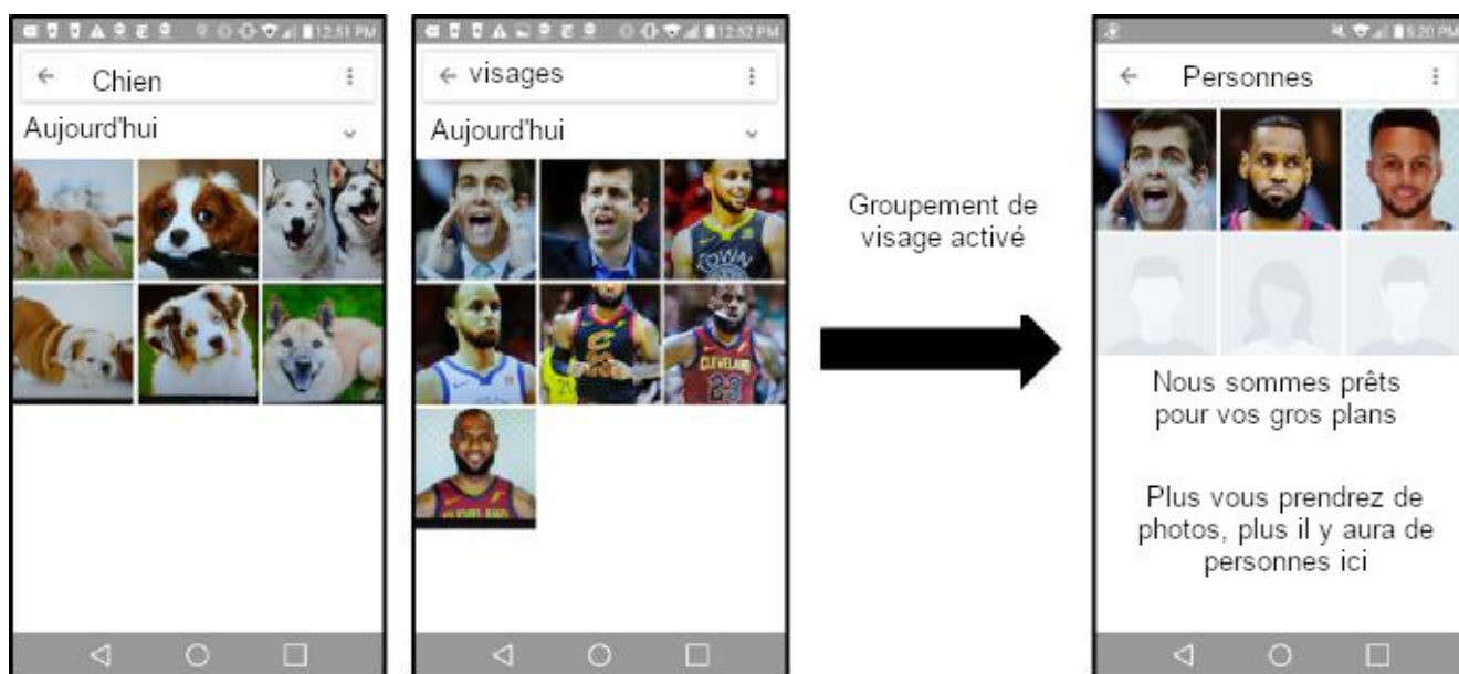
Illustration : Exemple de reconnaissance d'images dans Google Photos.

94. Google Photos effectue cette analyse d'image par défaut lors de l'utilisation du produit, mais ne fera pas de distinction entre les personnes, sauf si l'utilisateur donne l'autorisation à l'application 16 . Si un utilisateur autorise Google à regrouper des visages similaires, Google identifie différentes personnes à l'aide de la technologie de reconnaissance faciale et permet aux utilisateurs de partager des photos grâce à sa technologie de « regroupement de visages » 1718 . Des exemples des capacités de classification d'images de Google avec et sans autorisation de regroupement des visages de l'utilisateur sont présentés dans l'illustration 19. Google utilise Photos pour assembler un vaste ensemble d'informations d'identifications faciales, qui a récemment fait l'objet de poursuites judiciaires 19 de la part de certains États.