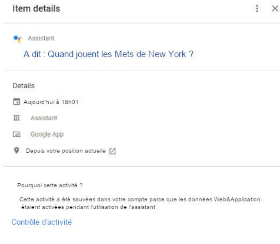
Figure 18 : Exemple de détails collectés à partir de la requête Google Assistant.