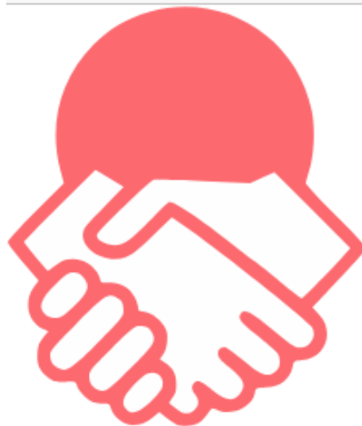
logo du projet Contribulle

...tu peux lister précisément les compétences requises. Contribulle a vocation de faciliter la compréhension de contributions auprès des personnes qui veulent aider. C'est pour ça qu'il nous semble nécessaire dans le formulaire de demande de contribution de bien présenter le projet et de donner plus d'indications sur la contribution souhaitée . Un projet se doit d'être sérieux et conscient du temps et de l'effort qu'un·e contributeur·rice y consacrera.