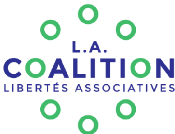
Logo L.A. Coalition

Le programme d'action de la Coalition s'étale pour l'instant, jusqu'à juin 2020.