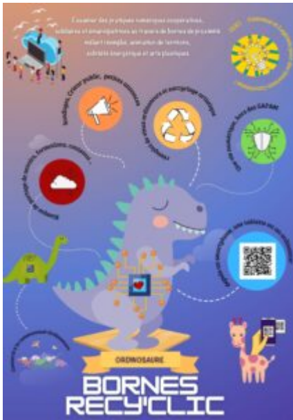
Une affiche de présentation des bornes Recy'clik par Uto de R(d)évolution