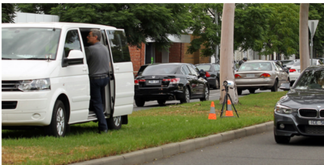
Le système existant qui scanne les plaques minéralogiques avec une caméra fixe

Mais c'est après quelques recherches sur Google que j'ai découvert que la Police de l'État du Victoria avait récemment testé un appareil similaire dont le coût de déploiement était estimé à 86 millions de dollars australiens. Un commentateur futé a fait remarquer que 86 millions de dollars pour équiper 220 véhicules, cela représentait 390 909 AUD par véhicule. On devait pouvoir faire mieux que ça.