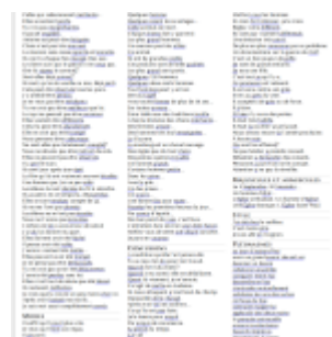
Exemples d'erreurs reconnues par Grammalecte 2

Entendre que Grammalecte permet d'apprendre de ses erreurs me fait plaisir, car il n'est pas toujours facile de faire en sorte que le message d'erreur soit instructif. La place est limitée, et parfois l'imagination fait défaut pour écrire un message à la fois simple et instructif. Par ailleurs, les explications ne sont pas toujours comprises (tout le monde ne sait pas ce qu'est un COD ou un participe passé). Les exemples, ce n'est pas toujours clair. Les messages trop longs ne sont probablement pas toujours lus. Et, pour des raisons techniques, il n'est pas toujours possible d'être explicite. Il y a encore du progrès à faire sur ce point. Si je le peux, je place un hyperlien vers une page web plus complète, mais les pages web sont parfois longues et les explications ne concernent pas toujours spécifiquement l'erreur concernée. Mais il est vrai que, contrairement à Word (qui ne fournit qu'une correction sans indication), Grammalecte tente souvent d'expliquer. Car le meilleur moyen d'éviter les erreurs grammaticales, c'est d'enseigner petit à petit à l'utilisateur à ne plus en faire. Le meilleur service que puisse rendre un correcteur grammatical, c'est de devenir de moins en moins utile. Mais il le sera toujours à cause des erreurs d'inattention que même les plus doués font.