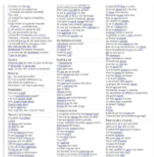
Exemples d'erreurs reconnues par Grammalecte 1

difficultés auxquelles il faut faire face. J'en ai parlé dans un long billet sur LinuxFR, alors je préfère ne pas me répéter ici.