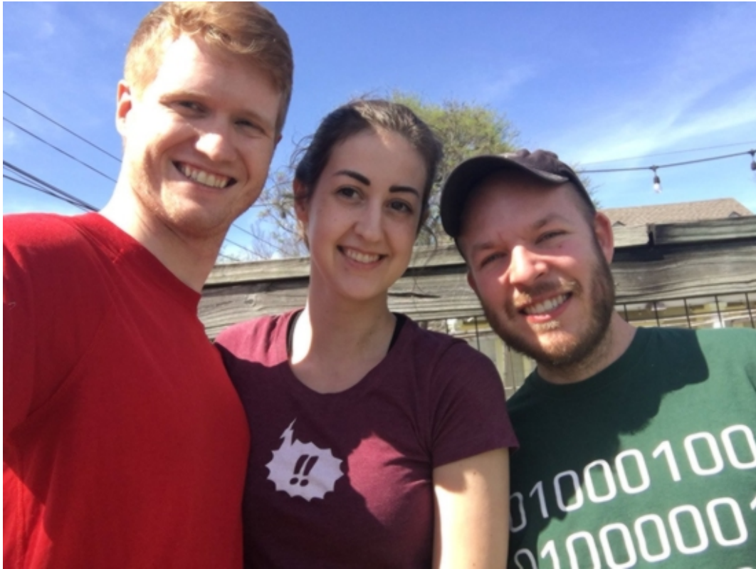
L'équipe Blue Link Labs

Nous travaillons sur Beaker car publier et partager est l'essence même du Web. Cependant pour publier votre propre site web ou seulement diffuser un document, vous avez besoin de savoir faire tourner un serveur ou de pouvoir payer quelqu'un pour le faire à votre place.