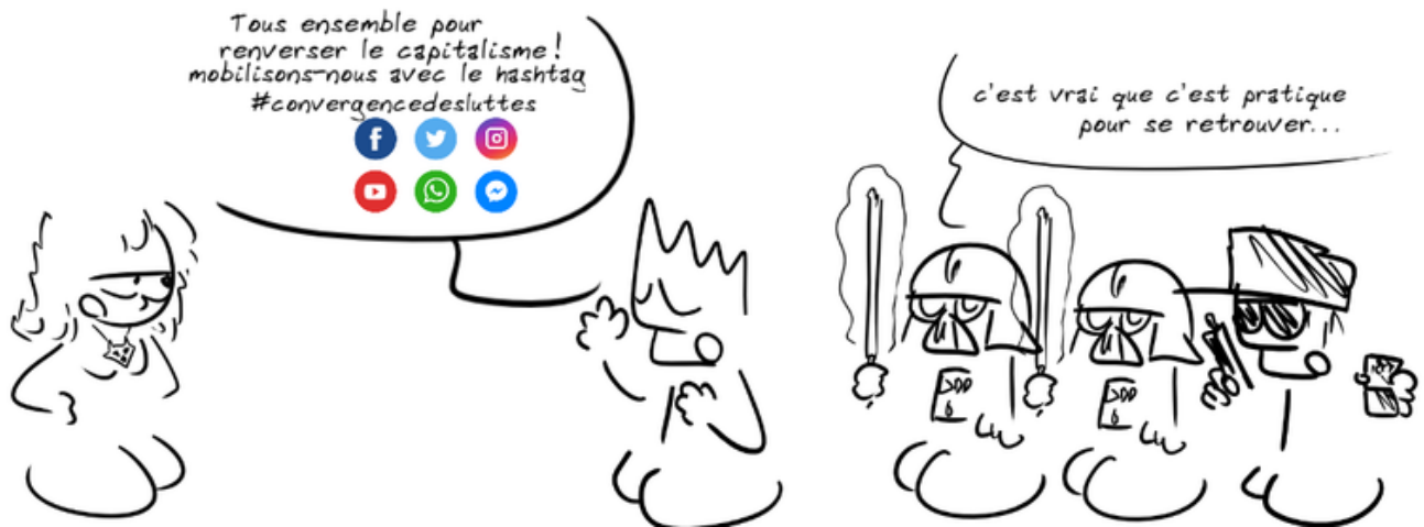
illustration réalisée avec https://framalab.org/gknd-creator/#