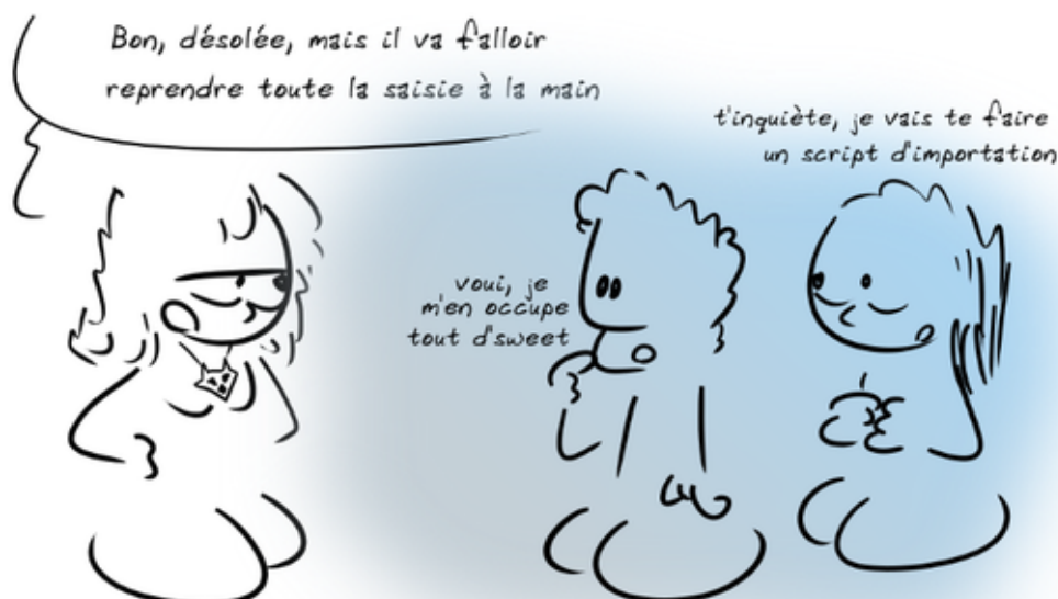
fig.1 Travailler en équipe pour résoudre un problème. La théorie.

En formant l'une des deux bénévoles, on s'aperçoit ensemble que de nombreuses données de l'ancienne base sont erronées depuis quelques mois (suite à une maintenance de M. Calisson) et que ces erreurs ont été (évidemment) reportées sur la nouvelle base. Nous arrivons à une conclusion terrifiante : il faut repasser manuellement derrière chacune des 1275 adhésions à partir des bordereaux d'adhésion, conservés par précaution. Cette opération nous a coûté 4 à 5 heures. La bénévole a eu la gentillesse de m'apporter une pizza pour que je puisse finir mon travail d'esclave le plus vite possible sans sortir du bureau.