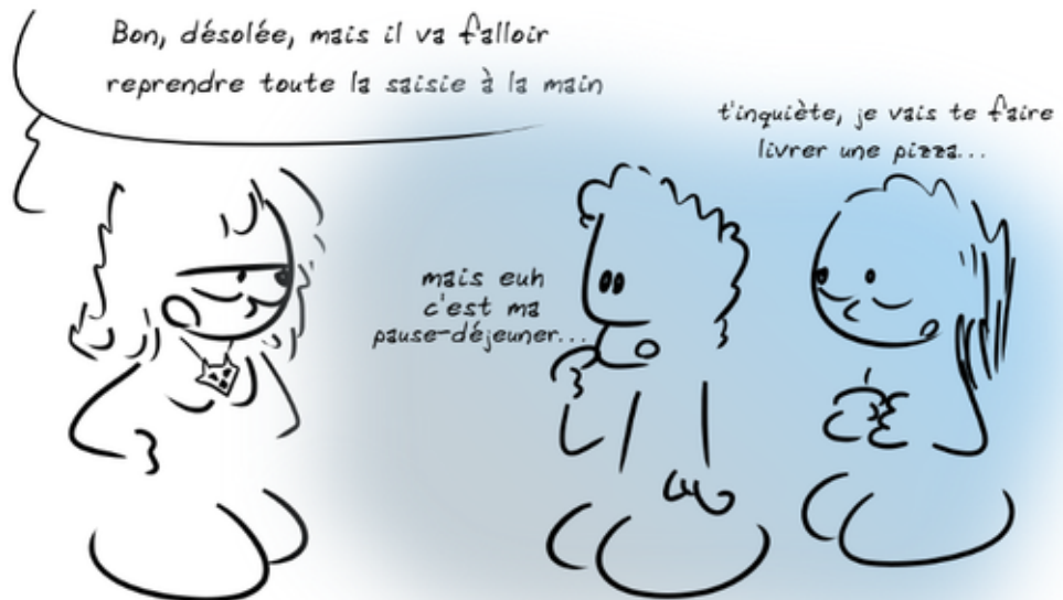
fig.2 Travailler en équipe pour résoudre un problème. La réalité.